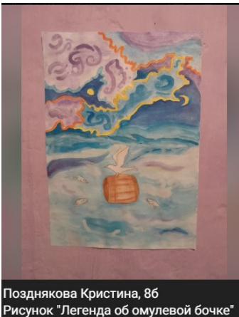
Позднякова Кристина, 86 Рисунок "Легенда об омулевой бочке"

В России 4 ноября отмечается День народ-