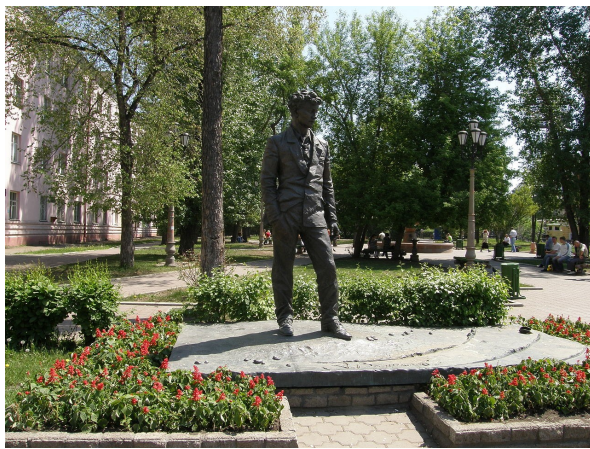
Памятник А. Вампилову в Иркутске

полностью деидеологизировано. Нигде в его художественных произведениях ни разу не употребляются слова «социализм», «коммунизм», «капитализм», «Ленин», «партия» и т. п. Произведения Александра Вампилова переведены на английский, белорусский, болгарский, венгерский, иврит, испанский, китайский, латышский, лезгинск